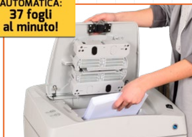
Cassetto da 300-350 fogli per alimentazione automatica con capacità distruttiva di 37 fogli al minuto.

ALIMENTAZIONE AUTOMATICA: 37 fogli al minuto!