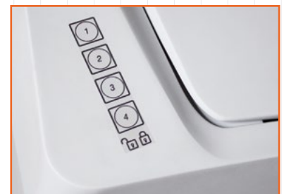
Chiusura elettronica a combinazione (Optional).