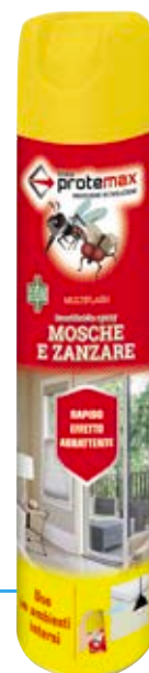
Bombola 500 ml