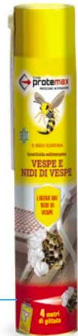
Bombola 750 ml