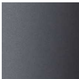
005 antracite anthracite