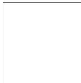
022 bianco white